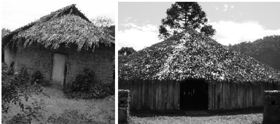
Figura 3 - Entrada do espaço onde são realizadas as cerimônias, denominado opy (casa de reza), na aldeia de Águas Claras e na sede do Fogo da Verdade

Finalmente, para o Fogo da Verdade, a presença dos Guarani constituiu uma forma de legitimar a reivindicação da origem indígena dos conhecimentos e ritos praticados pelo grupo. A imagem do “índio” tem um papel importante no contexto do universo new age e dos movimentos neo-xamânicos em geral. No caso do Fogo da Verdade, um dos principais fundamentos do discurso do grupo consiste na ideia do “resgate dos conhecimentos ancestrais” (i.e., indígenas), assim como na indiferenciação generalizada atribuída a esses conhecimentos, que teriam todos a mesma “essência”. Somado a isto, cabe lembrar que o contato entre esse grupo espiritual e a comunidade indígena de Águas Claras aconteceu ao mesmo tempo que o Fogo da Verdade estava começando suas atividades no Brasil. Desta maneira, a própria constituição do grupo no país foi intensamente marcada pelo diálogo com os Guarani.