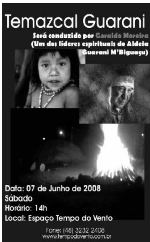
Figura 2 - Convite para temazcal Guarani

Entretanto, há outros elementos importantes que precisam ser levados em conta na tentativa de compreender este processo. Primeiro, é fundamental destacar que entre as aldeias nas quais ocorreram cerimônias durante o projeto financiado pela FUNASA, apenas Águas Claras deu continuidade à sua realização, sendo que frequentemente moradores de outras aldeias dentro e fora do Estado de Santa Catarina viajam para esta aldeia para participar das cerimônias. Por um lado, isso está ligado ao fato de que as cerimônias sempre tiveram como base essa aldeia; por outro, é importante ressaltar que muitos Guarani, principalmente de outras aldeias, não concordam com o uso da bebida, afirmando que se trata de “coisa de brancos”. Inclusive na aldeia de Águas Claras, algumas famílias, com o tempo, deixaram de participar das cerimônias, e certas pessoas passaram a criticá-las, questionando sua autenticidade enquanto tradição Guarani. Assim, entre os Guarani da rede das aldeias do litoral catarinense, e mesmo entre os moradores de Águas Claras, não existe um ponto de vista homogêneo ou um consenso sobre o tema, que continua sendo assunto de conversas, especulações, críticas e controvérsias.