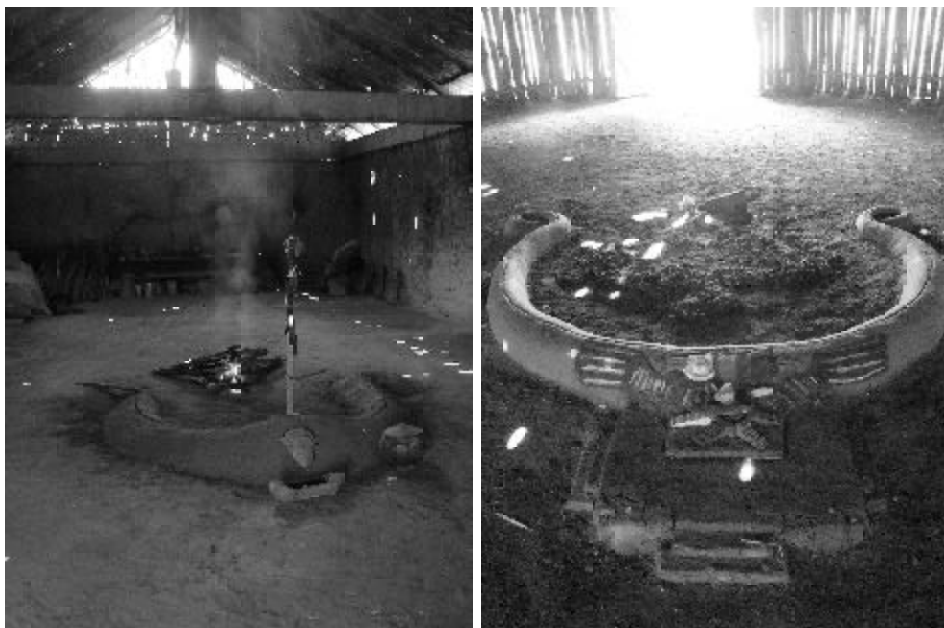
Figura 5 - Altar da meia-lua na casa de reza de Águas Claras e na sede do Fogo da Verdade