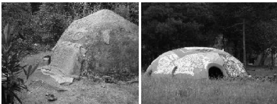
Figura 4 - Opydjere na aldeia Águas Claras e inipi para temazcal na sede do Fogo da Verdade