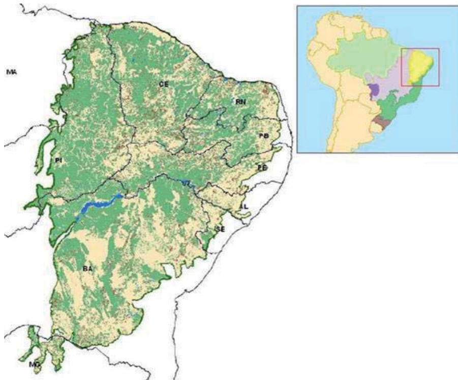
Mapa 1 – Distribuição do desmatamento da caatinga.

O bege representa o desmatamento anterior a 2002. O marrom, o desmatamento entre 2002 e 2008.