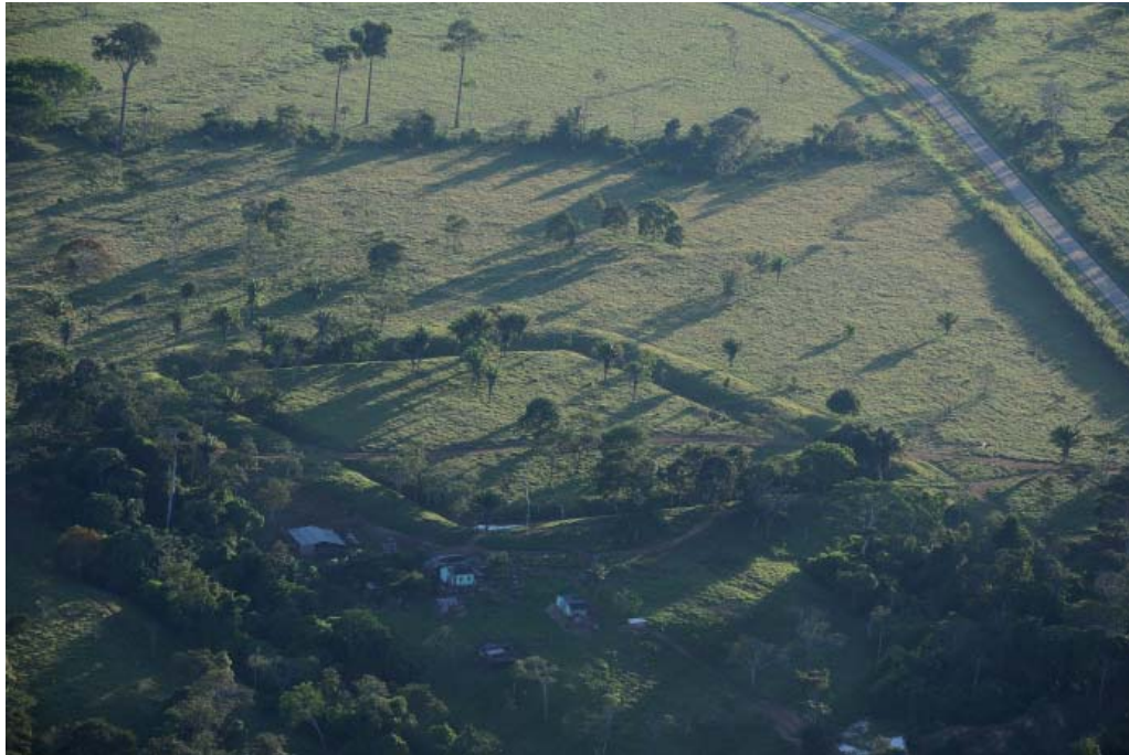
Figura 2 – Geoglifo no Estado do Acre, Brasil.